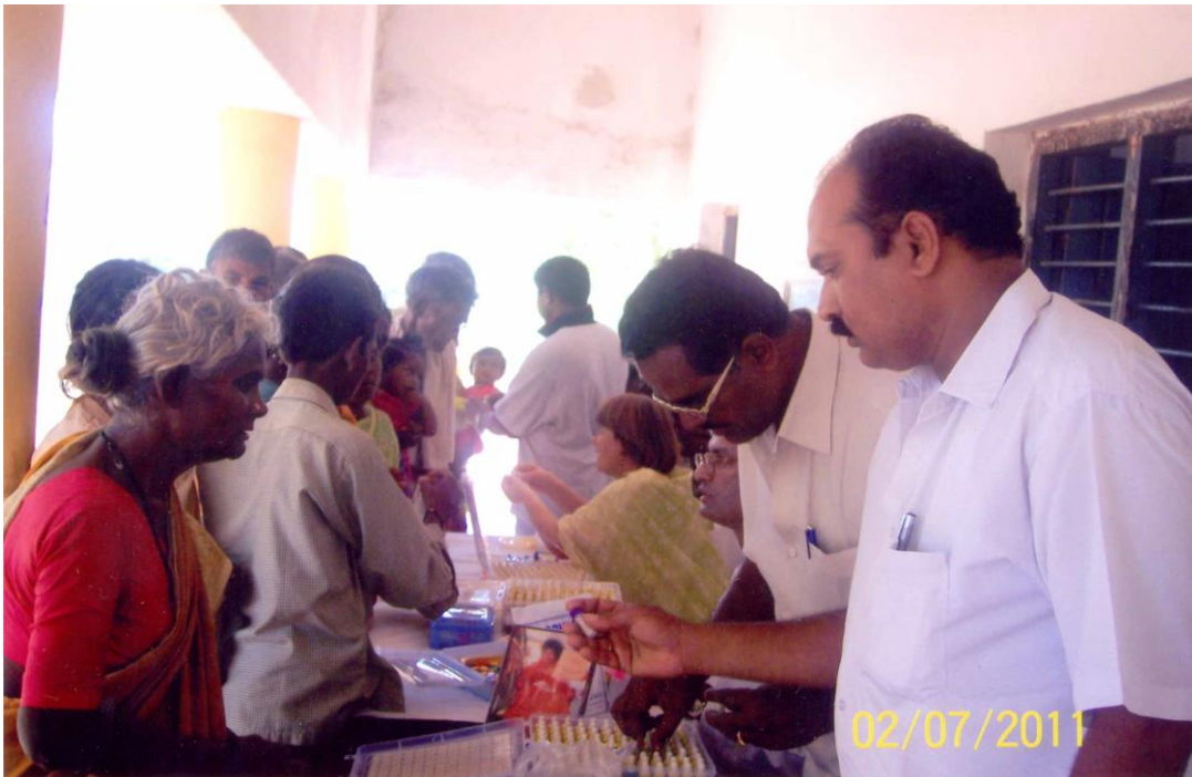
2 Septiembre 11: Campamento de salud Vibriónico realizado cerca a Puttaparthi..300 pacientes tratados

ATENCIÓN: Si su dirección de e-mail cambia en el futuro, sírvase informárnoslo a news@vibrionics.org tan pronto como le sea posible. Por favor comparta esta información con otros practicantes vibro que no estén enterados de este Nuevo servicio de e-mail.