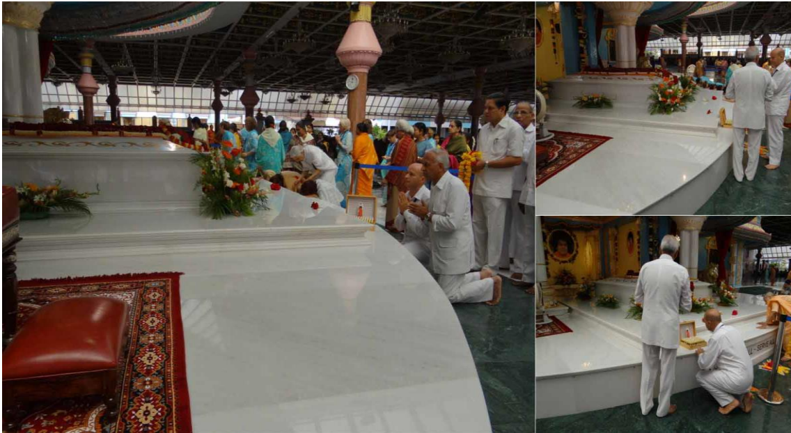
17 Agosto 2011: La Caja Maestra de Vibriónica de 108CC ofrecida en el Mahasamadhi de Bhagavan Baba